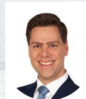
Yorick Meefout Activiteiten